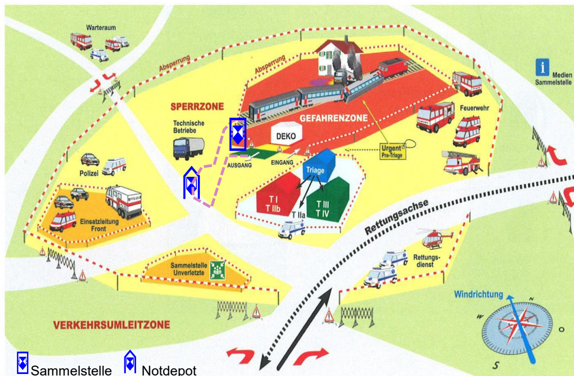
Abb. 1: Schadenplatzorganisation gemäss FKS mit möglicher Einbindung des KGS.

Der Arbeitsplatz des KGS sollte innerhalb der Sperrzone liegen (dient dem Schutz vor Diebstahl, für die Transportwege von der Übergabestelle (Sammelstelle) zum Notdepot).